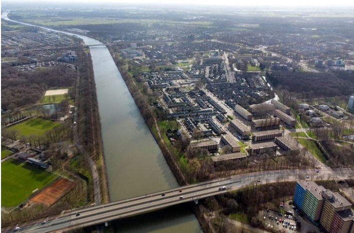
Het Maas-Waal kanaal met links de velden van SV Hatert. Rechts Zwanenveld

Ook komt er hoogbouw nabij de Jan Massinkhal. Hiervoor wordt een gedeelte van de bosschages opgeofferd tussen de hal en de Weg door Jonkerbos.