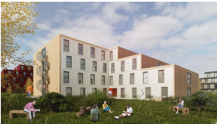
Referentiebeeld van tijdelijke, modulaire woningen die moeten verrijzen op de Winkelsteeg in Nijmegen.