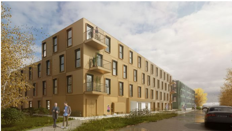
Referentiebeeld van tijdelijke, modulaire woningen die moeten verrijzen op de Winkelsteeg in Nijmegen.

bovendien ruimte voor woningbouw en werkruimtes. Datzelfde gebeurt ook met een deel van de rijbanen van de Neerbosscheweg nabij station Goffert: ook die worden tegen elkaar gelegd.